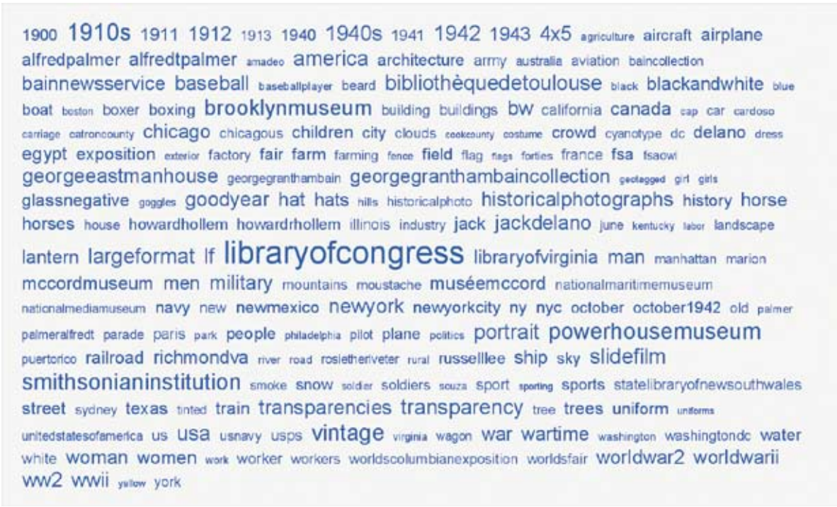
Illustratie: de 'Tag Cloud' (trefwoordenwolk) van Flickr the Commons: de meest aangeklikte zoektermen verschijnen het grootst weergegeven.

Het antwoord is uiteraard ja. De experts zullen zeggen dat het niet kan of onverantwoord is, maar dat zei de hoofdredacteur van de Encyclopaedia Britannica ook over Wikipedia. En het moment is er perfect voor. Het NA adviseert momenteel het ministerie van BZK over de metadatastandaard die onderdeel moet worden van de Baseline Informatiehuishouding Rijksoverheid. Het kan dus echt een klapper worden: geen twintig verplichte elementen, geen ingewikkelde DMS-inrichting, geen pull-outmenu's, geen verplichte documentsjablonen. Misschien alleen nog een vermaning: "If you're a dork about it, shame on you. This is for the good of democracy, dude!!" <<